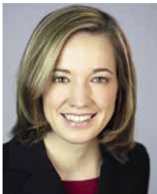
Bundesministerin für Familie, Senioren, Frauen und Jugend Dr. Kristina Schröder

Sehr geehrte Leserin, sehr geehrter Leser,